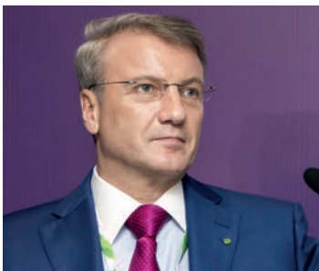
Герман Греф Президент, председатель правления Сбербанка России